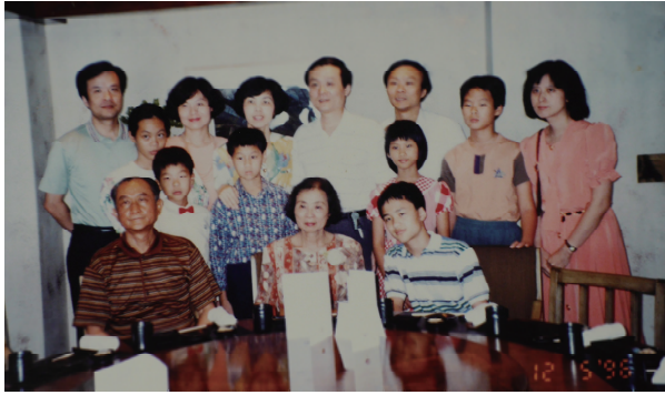
1996年時的三代同堂。