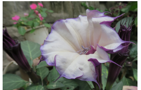
圖二十四 紫花曼陀羅