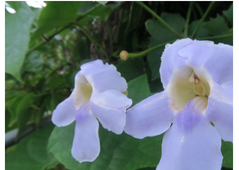
圖二十一 大鄧伯花