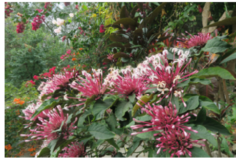
圖二十三 閃爍茉莉（煙火樹）