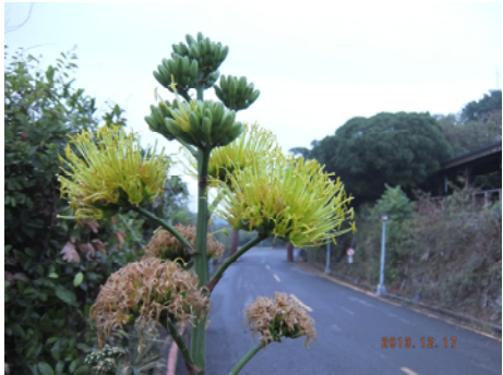
圖二十 黃邊龍舌蘭