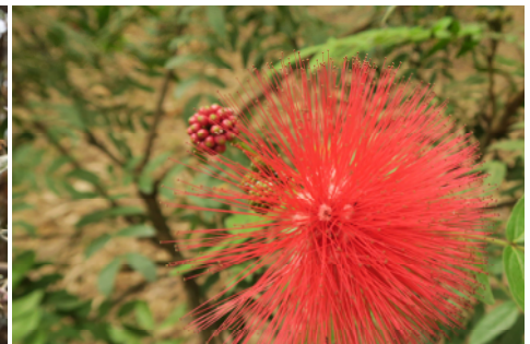
圖三 美洲合歡（紅合歡）