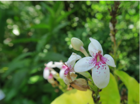
圖十九 金葉擬美花