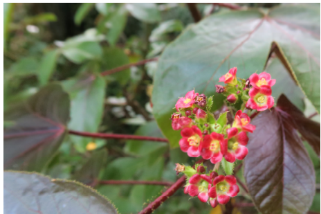
圖二十二 紅葉癡瘋樹