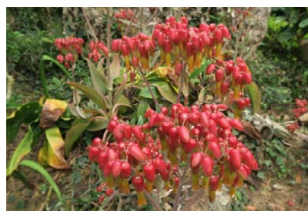
圖五 寬葉落地生根