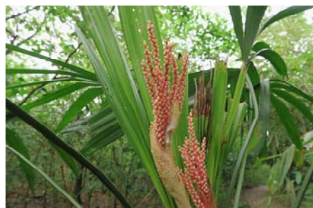
圖二十 觀音棕竹(雌花)