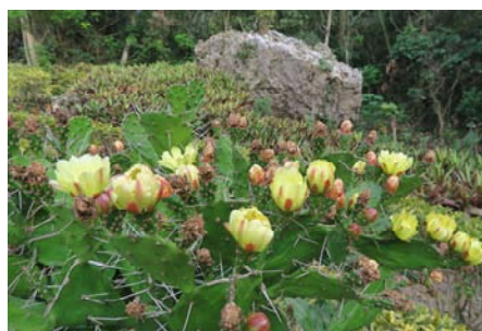
圖七 金武扇仙人掌