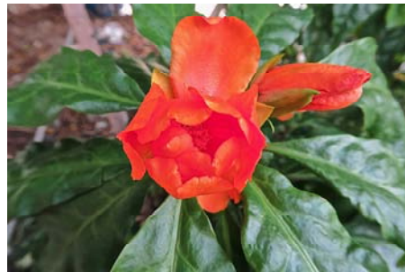
圖十六 玫瑰麒麟(花)