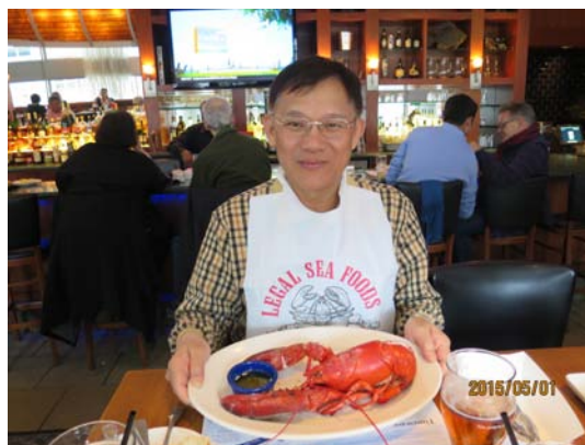
圖10. legal see foods大龍蝦。