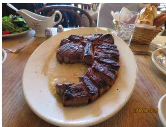
圖8. peter luger steak。

全紐約最好吃的牛排就是Peter Luger！Peter Luger連續28年被評選為紐約第一名的牛排館，餐廳的訂位不易，甚至要一個月前才訂得到位置。我們是特別央請旅館的經理協助，才訂到下午五點的位置。點了生菜沙拉、T-bone、steak for two、厚培根、紅酒。培根厚片厚實的口感和獨特的香氣，改變了從來不喜歡吃培根的我！