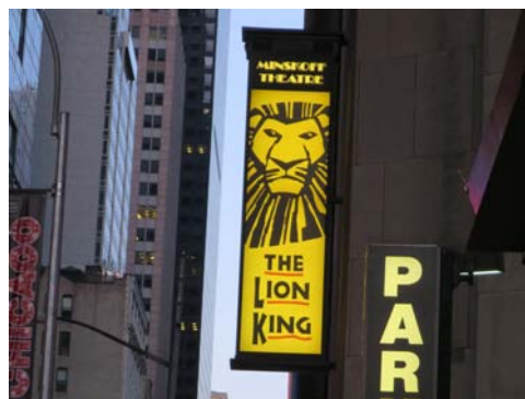
圖3. 百老匯獅子王劇場。

合一流或熱門品牌，從高檔的LV、Tiffany，到平凡的GAP、UNICLO都有。路過Magnolia cup cake專賣店，此店拜影集慾望城市之賜而紅遍紐約，繽紛鮮艷的彩色糖霜是它