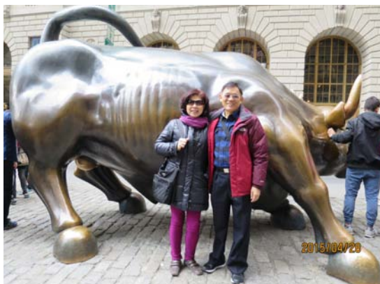
圖06. 華爾街公牛銅雕。

九點多，匆匆通過安檢，渡輪就出發。雖然很冷，但是遊客還是很多。渡輪從自由女神像左側、正面到右側後方，繞行一圈，讓我們看清楚每一個方向的自由女神，十幾分鐘後就到了自由島，登上自由島後，未訂到入場票，所以只好在外圍繞一圈，近距離觀賞，選個好角度拍拍照。自由島上的自由女神像正對著紐約港，已成為美國自由的象徵，是法國贈予美國的禮物(5)。身著長袍的自由女神，左手拿著美國獨立宣言，右手持著火炬，為新移民引領自由之路。緊接著再搭船參觀Ellis Island。Ellis Island是19世紀移民進駐美國的前哨站，移民博物館裡的移民大廳、美國之門，記載了當年移民的辛酸血淚史。結束遊船後，前往曼哈頓的華爾街。華爾街是曼哈頓金融機構最密集的地區，是美國經濟重鎮。公牛銅雕是華爾街的著名地標，股市上漲稱為牛市，看跌稱為熊市，我與太太摸一下這隻銅牛，希望能鴻運當頭(6)！新世貿中心就在附近，是九一一恐怖攻擊世界貿易中心的遺址，已在原址重建完成。南街海港是個充滿懷舊氣氛的休閒徒步區。17號碼頭旁，停泊三艘非常漂亮且復古風味的帆船，這裡也是欣賞布魯克林大橋的絕佳角度。附近