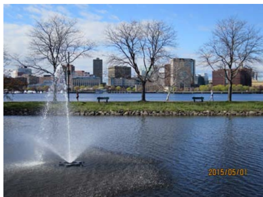
圖9. .charles river公園。

左岸是劍橋，右岸是波士頓，查爾斯河公園蠻漂亮的，有不少人在這裡慢跑，我們則忙裡偷閒，徜徉在此，真得很愜意！（9）