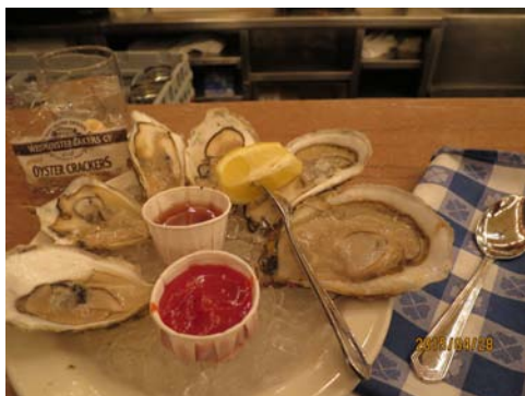
圖2. oyster bar 大生蠔。

接著到中央車站(1)。中央車站具有百年歷史，負責載送乘客往返紐約各城鎮，不僅是車站，還