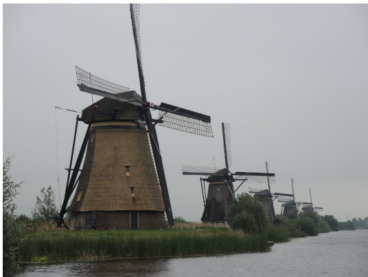
圖8. 小孩堤防壯觀的風車美景。

念是；就如一棵棵的樹木佇立在地面有限的空間中，方塊屋群在上面就像樹枝葉一樣，向外伸展出一片都會建築叢林，因為每天都有川流不息的觀光客，而且探頭探腦，問東問西，其中一個住戶乾脆開放住家，收費讓人參觀。