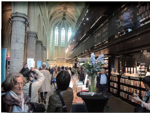
圖4. 教堂柱列區隔成層層書架，成為「天堂書店」。

森林國家公園的正中央座落著庫勒慕勒博物館，因珍藏梵谷作品數量僅次於梵谷美術館而聞名，此外還擁有全歐最大的露天雕塑展示場，展出羅丹及亨利摩爾等名家的雕刻作品，博物館館位於自然公園內，象徵著自然、藝術與建築的結合，公園佔地5500公頃，有42多公里的腳踏車道，原本計劃花一天點時間，騎著公園提供的免費腳踏車遊覽園內的各個景點，無憂無慮地倘佯在森林中，找個花叢綠地野餐，放鬆身心，無奈一陣意外的小雨讓所有美夢泡湯，同行小姐因雨