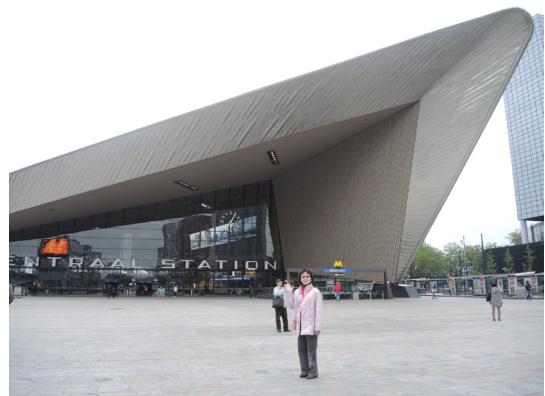
圖10. 鹿特丹中央車站，銀白色流線形的外表。