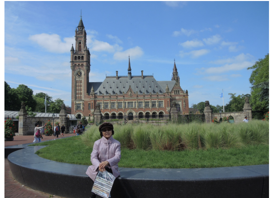
圖12. 海牙和平宮，大理石上以各國文字刻上「Peace和平」。

荷蘭畫家梅斯(1831-1915)於1880受僱於一家比利時公司，畫一幅面對著北海的席凡尼漁村的超大型畫作，整幅畫長高為120x14公尺，是全世界最大的一幅全景畫作，1881完成時，全景畫已不流行，公司於1886倒閉，梅斯達在拍賣會上把畫買回，自掏腰包繼續虧本展出，1903他將住家及所有繪畫