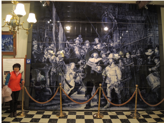
圖11. 「夜巡」的巨型陶瓷。

海牙：荷蘭第3大城，有皇家之都的稱號，是荷蘭的政治中心，有許多政府機構、國會議事堂、大使館和國際組織，和平宮(12)被認