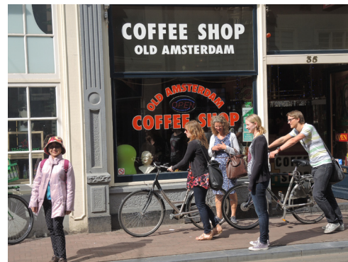
圖2. 處處可見掛著「Coffee shop」招牌的大麻店。