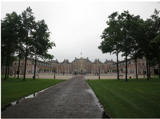
圖5. 皇室避暑狩獵的別墅－羅宮。

小孩堤防( Kinderdijk)自中世紀開始，荷蘭人發現利用風力轉動葉片，可以產生動力，用來研磨小麥，也可以改裝成轉動的水車，成為排水的工具，於是全國各處低地興建了無數排水風車，讓很多原本早該沈沒的低地，再為人所居