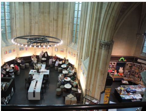
圖3. 彩色玻璃窗映照下的主祭壇成了咖啡座。

在歐洲每到一個城市都會參觀教堂，這次也不例外，看多了千篇一律，不會留下什麼印象，但這次却對多明尼克教堂留下深刻的印象，多明尼克教堂被出租改裝成書店，店名為Selexyz Dominicanen，Selexyz書店是荷蘭大型連鎖書店，由於現代人越來越不熱衷宗教，尤