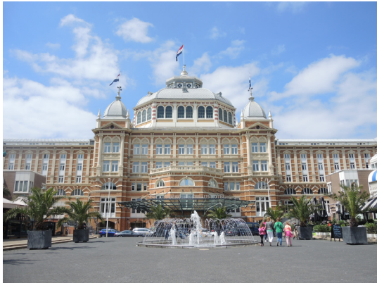
圖13. 席凡寧根氣派奢華的Kurhaus飯店。