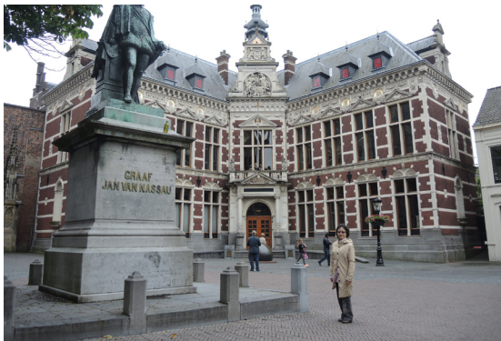
圖6. 烏特勒支大學本部。

住，19世紀全荷蘭曾有9000座風車，處處可見，後來因風車功能已被幫浦取代而逐漸拆除，小孩堤防( Kinderdijk) 在距鹿特丹東面10公里處，在萊克河與諾德河交匯處，