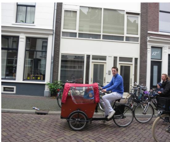
圖1. 自行車是主要交通工具。

平坦是荷蘭地形的特點，國土面積一半低於1公尺，26%低於海平面，部分地區圍海造地形成，是世界第三大農產品出口國，牧畜業發達，世界上乳酪產量最大國家，平均每人擁有2輛自行車(1)，1/10頭牛，一頭豬，GDP超過5萬美元，為世界前10名，有「歐洲花園」「風車之國」「鬱金香王國」之美名。社會風氣自由開放，是世界第一個「同性婚姻」「安樂