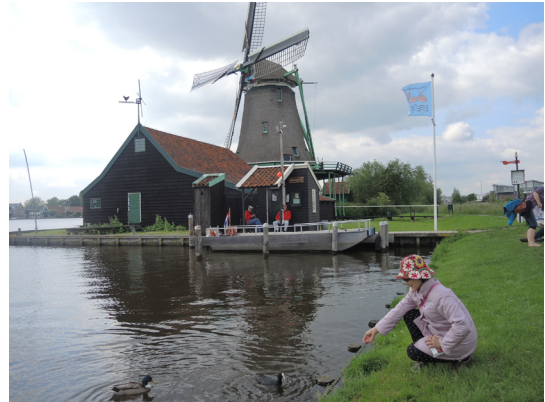
圖14. Zaanse Schans色彩艷麗的風車。