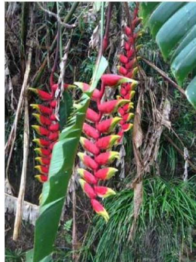
圖9..珍貴的金鳥赫蕉

40回到奉天岩，看到珍貴的金鳥赫蕉，（圖9），此時已經接近阿里山鐵路的獨立山車站，附近商家的愛玉冰有名，我狠吞兩碗，哇！透心涼，稍事休息，往下走獨立山古道，牛稠溪常半左右，牛稠溪是朴子溪的上游，朴子溪在台灣西岸的「東石」出海，下午5:20回到樟腦寮車站，2009年8月2日，高雄市醫師登山隊曾經來到此地，有5攤販賣當地農產品的農戶，產品有竹筍，半天筍（檳榔樹嫩芽），香蕉，蔬菜，現在（2013年8月18日）只剩一家，見微知著，台灣的經濟活動真的是衰退了。