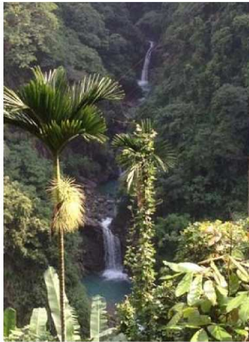
圖5 甕缸瀑布與檳榔花