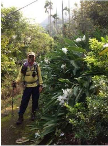
圖4 白色野薑花飄著淡淡的香味