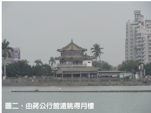
圖二、由蔣公行館遠眺得月樓

清湖棒球場，及長庚醫院。來得月樓餐廳進食，出示醫師執照，嘴念口訣「我曾經是長庚醫院的醫師」可以打九折。