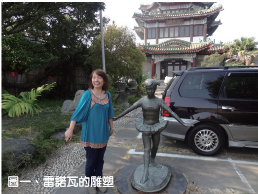
圖一、雷諾瓦的雕塑