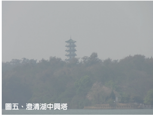
圖五、澄清湖中興塔