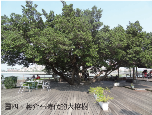
圖四、蔣介石時代的大榕樹