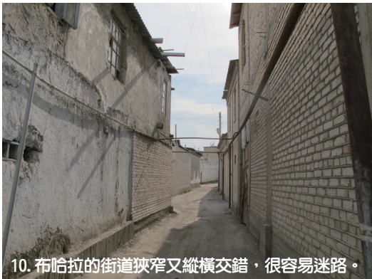
10. 布哈拉的街道狹窄又縱橫交錯，很容易迷路。

撿，忽然驚覺「我一生從不在任何人前鞠過躬，但此塔之宏偉壯麗值得我的一鞠躬」因此逃過一劫，但還有一劫，1920俄羅斯攻入後，以大砲轟擊此塔，但未轟倒，只打出了幾個洞，現已補平，但圓圓的炮擊痕跡仍清晰可見(9)。此塔另有一個恐怖的名字叫「死亡之塔」，當年的死刑犯會被帶到塔頂，在法官唸完「願真主赦免你的靈魂」後，被推出去，當眾摔個粉身碎骨。