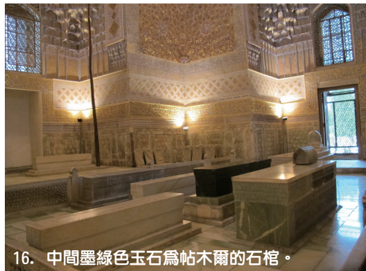
16. 中間墨綠色玉石為帖木爾的石棺。

玄奘當年從長安出走，經甘肅、新疆到碎葉城(現吉爾吉斯阿克貝希姆，李白的故鄉)，再經過赭時國(塔什干)，走向此行最西一站颯秣建國(撒馬爾罕)，沿途記錄「從此西北入大沙磧，絕無水草，途路彌漫，疆境難測，望大山，尋遺骨，以知所指，以記經途」，終於抵達撒馬爾罕，他記下了自己的第一印象「異方寶貨，多聚此國，土地沃壤，稼穡備植，林樹蓊鬱，花國滋茂，多出善馬，機巧之技，---，其王豪勇，---，兵馬強盛，---」，此後往南行向印度取經，沿