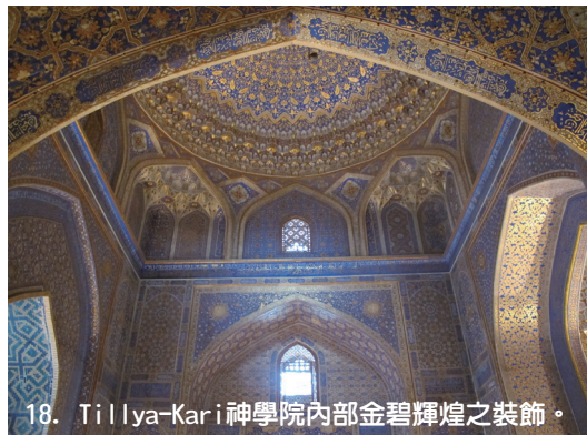
18. Tillya-Kari神學院內部金碧輝煌之裝飾。