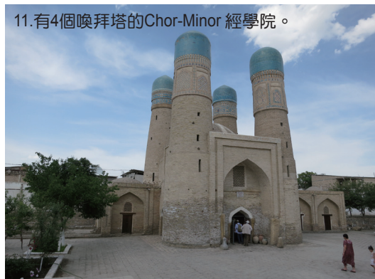
11. 有4個喚拜塔的Chor-Minor 經學院。

阿里巴巴與40大盜，芝麻開門的故事就發生在布哈拉，因為街道狹窄又縱橫交錯，很容易迷路(10)，因此強盜要在阿里巴巴的門上做記號，否則半夜認不出來，這個一點也不誇張，第二天導遊要帶我們幾個人去看一個很特別的神學院，結果也在巷道中迷路，最後多虧一位當地人協助才走出迷陣，找到 Chor-Minor經學院(11)，此院建於1807，有四個喚拜塔，很罕見，四塔代表四個朝代，中間的穹頂代表天空和一個神。此行很意外地跟當年的大盜一樣，連在專業導遊的帶路下，也在巷路內迷路，很有趣，只可惜，現在已看不到任何一絲阿