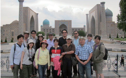
17. 以雷吉斯坦廣場上的3大清真寺為背景拍團體照。

話說美貌的帖木爾大老婆，比比哈藍，想要給他在外征戰的丈夫一個驚喜，她要蓋一個無以倫比的建物，她召來各地之建築師，藝術家，工匠，馬上動工，工程進行快速又順利，忽然前線傳來消息，帖木爾在中亞的戰爭已經結束，即