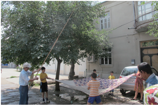
7.父拿長竿敲打，小孩執布巾接住落下之桑椹。