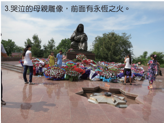
3.哭泣的母親雕像，前面有永恆之火。