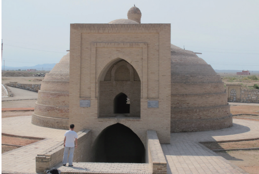
12.走下去便是驛站的水井。