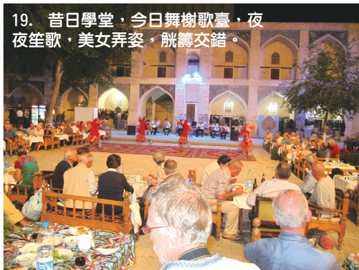
19. 昔日學堂，今日舞榭歌臺，夜夜笙歌，美女弄姿，觥籌交錯。

這次的中亞之旅有很多的意外，沒想到中亞有這麼豐富的人文、歷史、地理和傳奇，三個古城都有看不完的神學院，可見當年此地對學術之重視，不僅只是會做生意而已，怪不得中亞會成為伊斯蘭文化及學術中心，數學及天文等文明更勝當時之歐洲，中亞之旅讓我深深地感覺到，這個世界還有無數的地方，值得去探索，可是我們還有多少時間和精力。