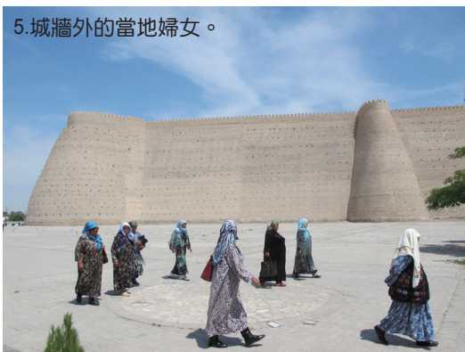
5.城牆外的當地婦女。