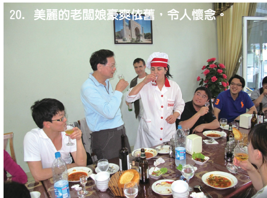
20. 美麗的老闆娘豪爽依舊，令人懷念。