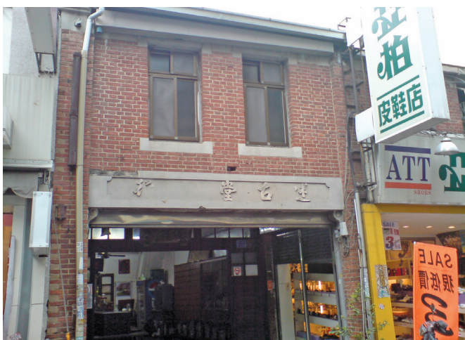
和平路的述古堂藥房

1930年代，每天清晨由附近鄉下，阿蓮、田寮、燕巢等地農民，用牛車載農產品來到平和路的「述古堂」藥房附近作買賣，於是平和路