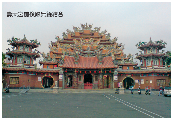
壽天宮前後殿無縫結合