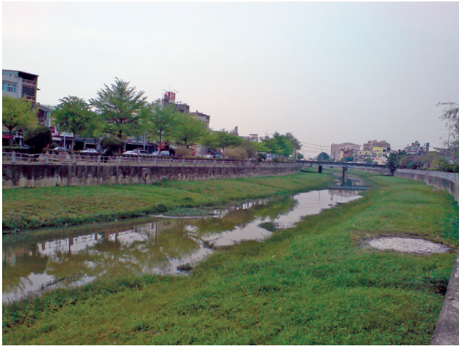
流經岡山區中心的阿公店溪

築，外形設計線條簡約，兼具典雅與前衛，連續高聳的尖形拱窗，鑲嵌著墨色玻璃，從二樓直到屋頂，高貴大方，高度並隨著屋簷逐次縮減，是本建築的最大特色。