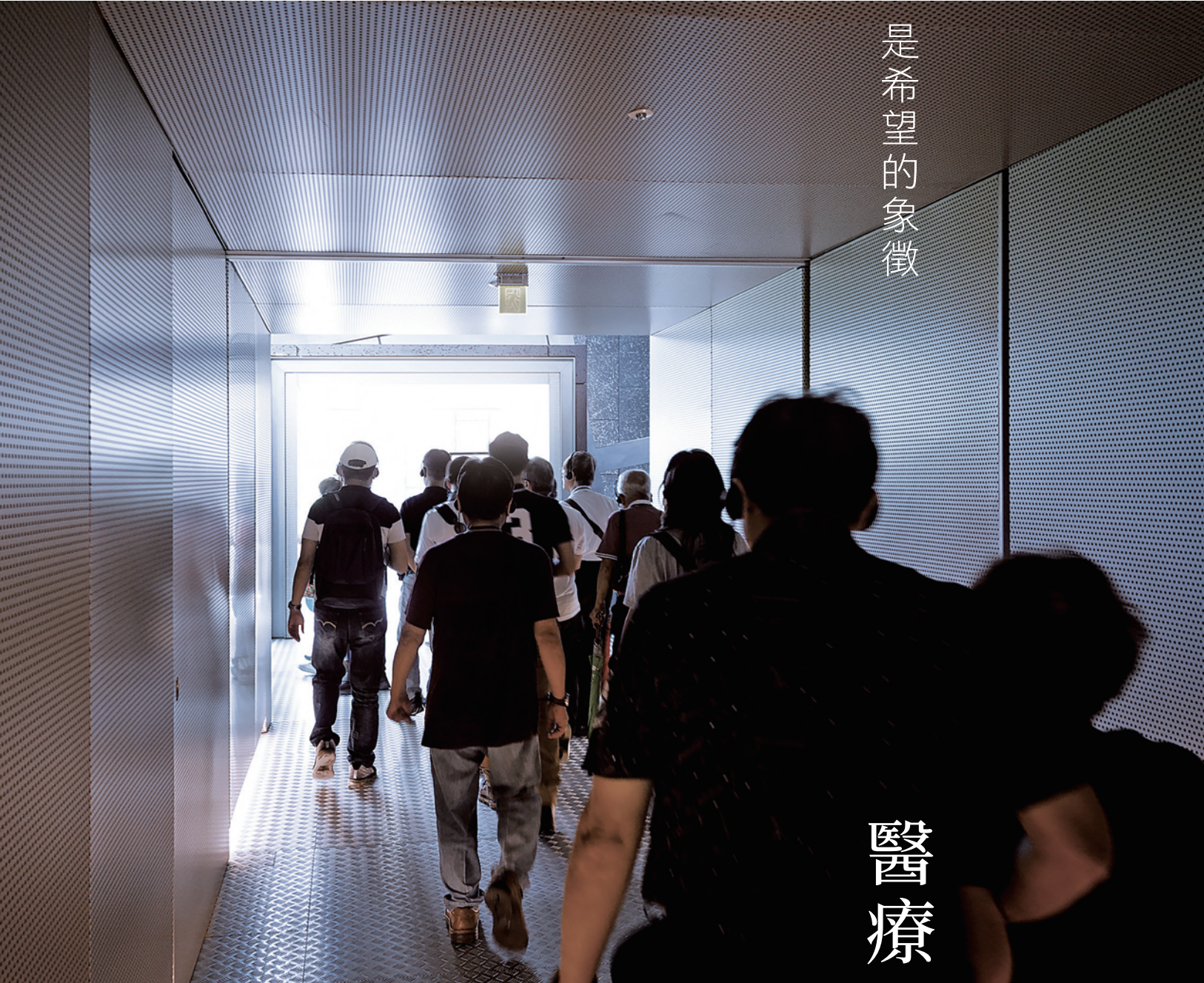
攝於國立台灣史前文化博物館