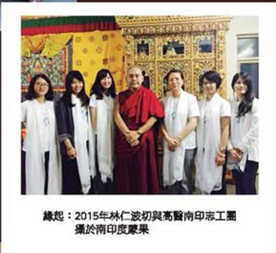
緣起：2015年林仁波切與高醫南印志工團攝於南印度摩果

佛是真的福田，用真誠的心信佛，把佛的教誨落實在我們的生活中，形就處事待人的標準，這就是無上福田。