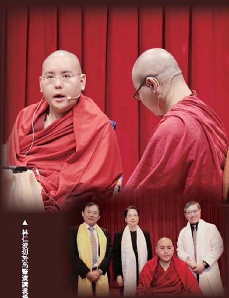
▲ 林仁波切於高醫演講現場真錄