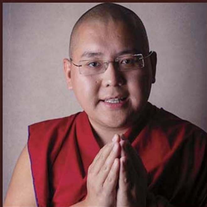
第七世克永永津林仁波切

現年35歲的第七世林仁波切是法王達賴喇嘛的轉世上師，隨然曾經是為法王上師，這世還是必需按步就班重新學習，以法王為師，因此這宿世互為師長的因緣，是非常難得的。應該是為了利益眾生，乘願再來的。仁波切出生在北印度的達蘭薩拉，之後至南印度蒙果的哲蚌寺學習，於2016年取得了格西（佛學博士）學位，畢業之後，開始於世界各地弘揚佛法。