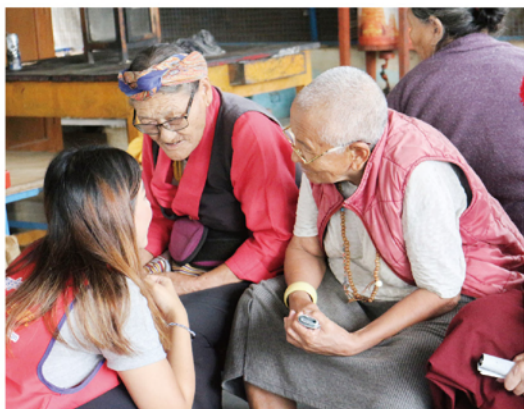
< 2019南印志工服務 >

高雄醫學大學醫學影像暨 放射科學系四年級學生 2016高醫醫管資副系會長 2016高醫同團社宣傳長 2018花蓮打工換宿志工 2016小琉球營隊副召 2017糖寶寶夏令營總召