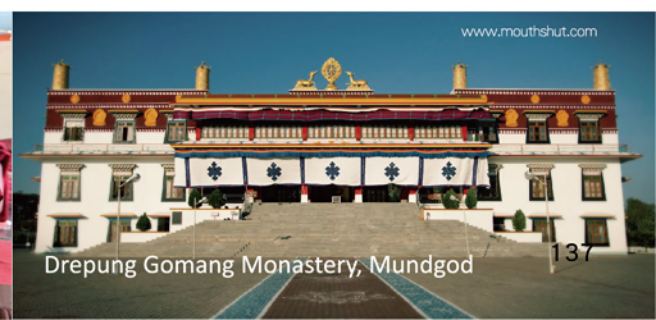
Drepung Gomang Monastery, Mundgod