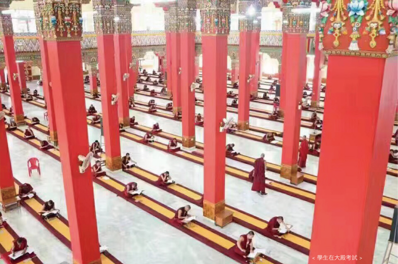
< 學生在大殿考試 >