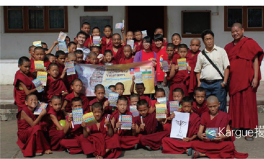
< Kargue 搗舉小學 >

對於沒有真正選擇餘地的孩子，教育和僧侶、女尼學校為他們提供了最好的機會。實際上，寺院的運作方式就像寄宿學校一樣。